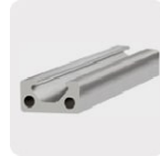
Metales no ferrosos