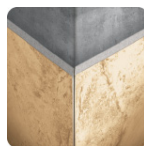
Para cortes precisos y limpios