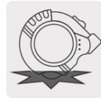
Resistente a impactos