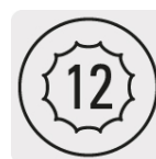
Puntas para tuercas hexagonales y cuadradas