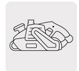
Para lijadora de banda