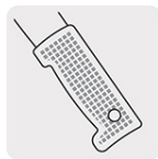
Cacha recta inyectada