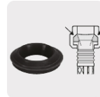
Empaque antifuga con diseño cónico