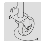
Rodajas de poliuretano que giran 360°