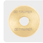
Cuchillas con recubrimiento de titanio