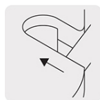
Cavidad para cortar fleje