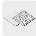
Loseta y cerámica