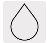
Para cortes en húmedo