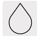
Para cortes en húmedo