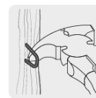
Uña para remover grapas