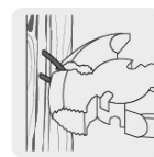
Tenaza para remover grapas