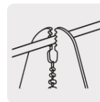
Pela cable de cobre y aluminio