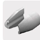
Mordazas de acero