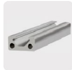
Metales no ferrosos