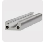
Metales no ferrosos