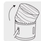
Ranura amplia para remover