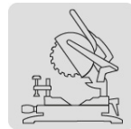
Para sierra de inglete