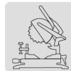
Para sierra de inglete