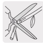
Muesca para corte de ramas