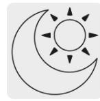
Uso de día y noche