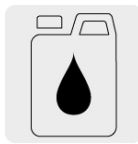
Incluye un bote de 250 ml de aceite monogrado SAE30