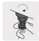
Válvula de drenado