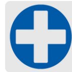
Punta de cruz