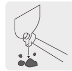
Martillo para romper terrones