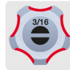
Marcado y código de color