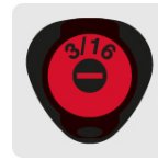
Marcado y código de color