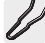
Bastidor 1 pieza