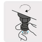
Válvula de drenado