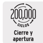
Cierre y apertura