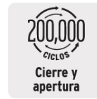
Cierre y apertura