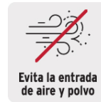
Goma de PVC