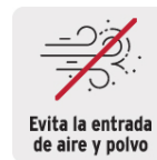
Evita la entrada de aire y polvo