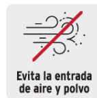
Goma de PVC