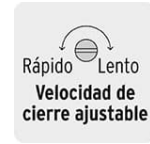
Rápido Lento Velocidad de cierre ajustable