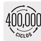
Cierre y apertura