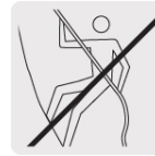
No usar para escalar