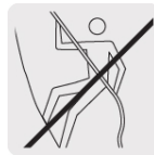
No usar para escalar