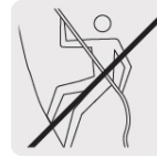
No usar para escalar