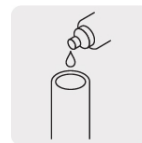
Aplica cemento solvente