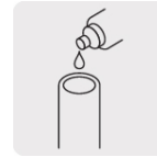
Aplica cemento solvente