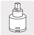
Cartucho cerámico (CARMO-1)