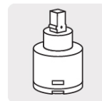
Cartucho cerámico (CARMO-1)