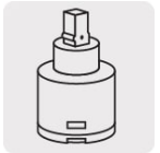
Cartucho cerámico (CARMO-2)