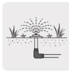
Para sistemas de riego y jardín