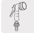
Pistolas para riego