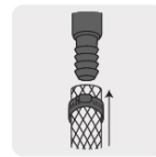
Para manguera rígida