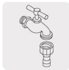
Laves de jardín