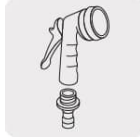
Pistolas para riego