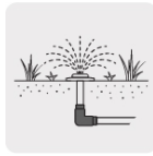
Para sistemas de riego y jardín