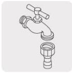
Laves de jardín