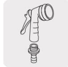
Pistolas para riego