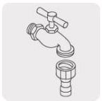
Laves de jardín