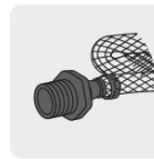
Para manguera flexible