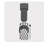
Para manguera rígida