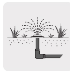
Para sistemas de riego y jardín